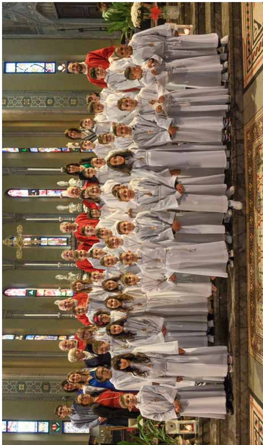
SANTA CRESIMA 28 MAGGIO 2023