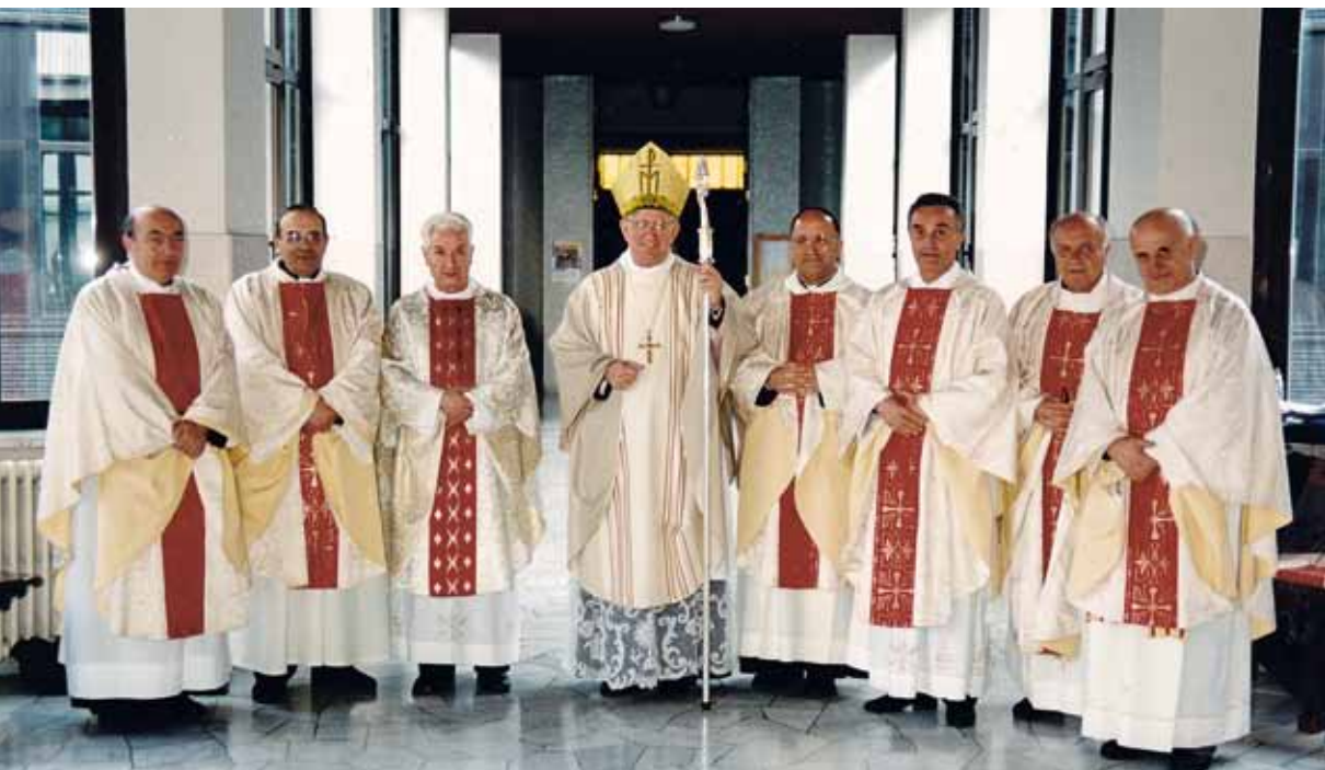
il quarantesimo di sacerdozio con i suoi compagni

Ho servito fedelmente la Chiesa, attraverso l'obbedienza ai miei superiori, anche quando è costata, e attraverso il ministero che ho cercato di vivere con fe-