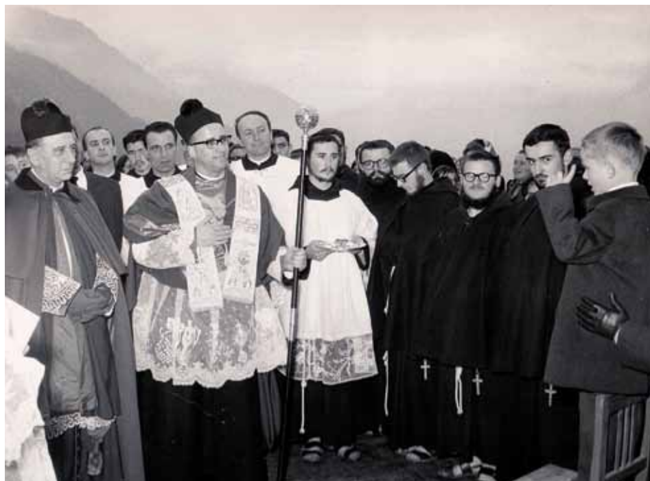
Entrata ad Albosaggia