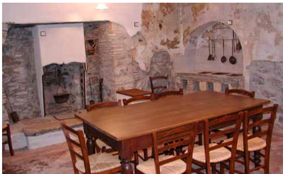
Cucina del Parroco don Guanella

Pianello del Lario (CO), 8 febbraio 2012